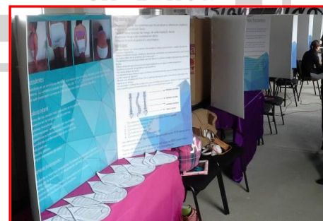
Ejemplo de mampara (s).